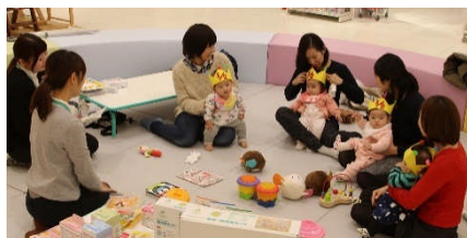
ハーフバースデー会