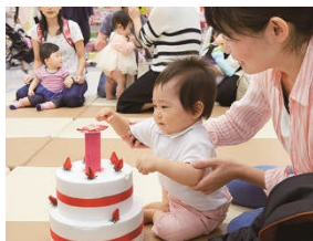
1歳のおたんじょうび会