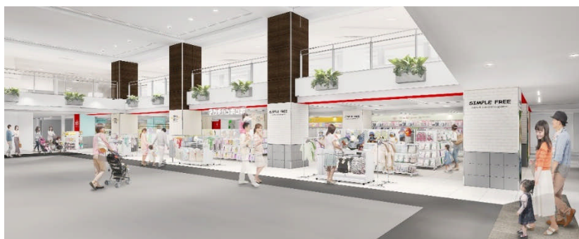
店舗入口イメージ

標準パターンの売場面積の店に比べ、小規模展開であることから、見せ方やサービス面で新たな取り組みを実施します。肌着の展開方法を、素材別からサイズ別に変更してお買物時間を短縮したり、通常ケース売りの紙おむつをパック売りに限定して、持ち帰りを楽にするなど、お買物が時短・簡単・便利になるような取り組みにトライします。さらに、4月5日（金）～15日（月）のオープンセール期間中、対象品の送料無料キャンペーン（配送対象エリア内のみ）を実施するなど、お客さまの利便性を高める施策を展開していきます。