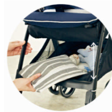
出し入れしやすい フロントイン・ビッグバスケット

バスケットの間口が広く、出し入れしやすい設計。前後どちらからでも荷物の出し入れができ、荷物が多くなる赤ちゃんとお出かけに便利なバスケットです。